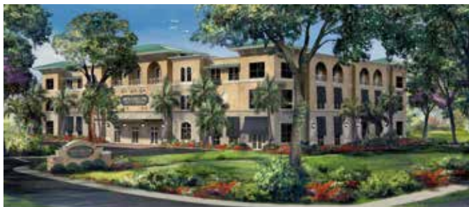
Objekte, die bereits Bestandteil des TSO Active Property III-Portfolios sind: die hochwertige Büroimmobilie Mansell in Alpharetta in Georgia und ein modernes Selbstlagerzentrum (hier eine Konzeptgrafik) in Naples in Florida.