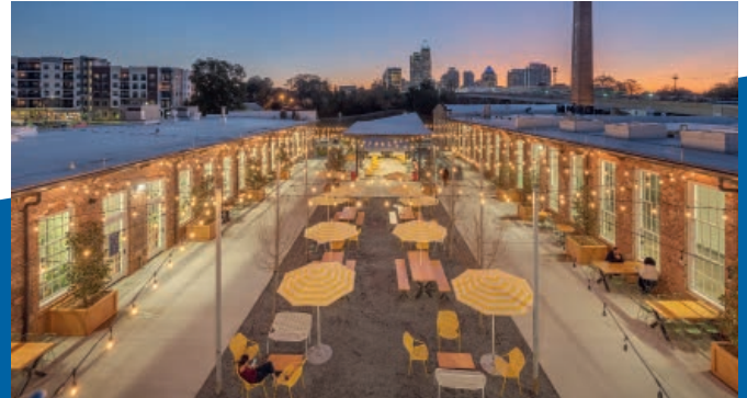
Einzigtartiges Büro- und Einzelhandelskonzept in einem aufstrebenden Stadtteil

Hinweis zur Pandemie: Aufgrund der Corona-Krise kann es zu zusätzlichen Mietausfällen und längeren Vermietungszeiträumen kommen, als in den Prognosen unterstellt wurde.