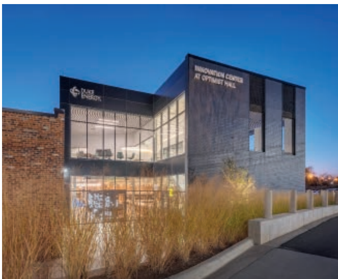
Duke Energy hat einen Zehnjahresvertrag für die gesamten Büroflächen abgeschlossen

Die Büro- und Einzelhandelsimmobilie ist derzeit zu 94% an einen Büromieter sowie 22 Einzelhändler und Restaurantbetreiber vermietet. Der größte Mieter ist der Energieversorger Duke Energy, der die gesamten Büroflächen (8.429 qm) für die nächsten zehn Jahre belegt. Duke Energy ist im Aktienindex S&P 500 gelistet und beliefert sieben Bundesstaaten mit elektrischer Energie. Das Unternehmen hat in Charlotte seinen Firmensitz und betreibt in den Flächen sein Innovationszentrum. Der Vermietungsstand der Einzelhandels- und Gastronomieflächen (3.616 qm) liegt aktuell bei 77% und der Mietermix besteht überwiegend aus regionalen Einzelhändlern und Restaurantbetreibern mit einer durchschnittlichen Mietlaufzeit von 6,7 Jahren ab 2020.