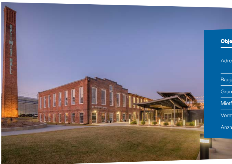
Die ehemalige Textilfabrik Optimist Hall wurde zu einer Büro- und Einzelhandelsimmobilie umgebaut

von einer hohen Lebensqualität sowie einer Vielzahl von sehr guten Bildungseinrichtungen und zählt zu den wachstumsstarken Regionen des Landes. Charlotte hat sich in den letzten Jahren als wichtiger Standort des Bank- und Finanzwesens etabliert, so hat unter anderem die Bank of America, die zweitgrößte Bank der USA, dort ihren Hauptsitz. Darüber hinaus haben einige umsatzstarke Unternehmen des Landes aus dem Versicherungswesen, dem Energiesektor oder der Fertigung ihren Firmensitz in die Region verlegt, da Charlotte als wirtschaftsfreundlicher Standort gilt.