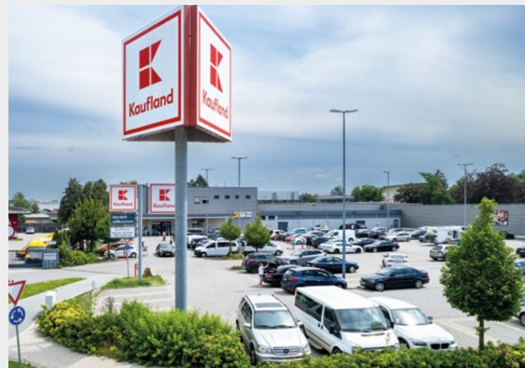
Bild, Straubinger Straße 64, 94405 Landau an der Isar

Die dargestellten Logos sind Eigentum des Unternehmens.