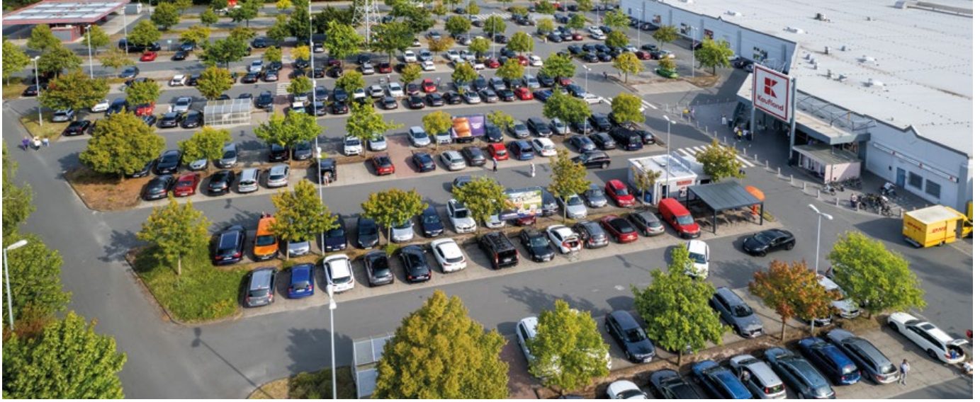
Luftbild, Bohmsiel 1, 27572 Bremerhaven